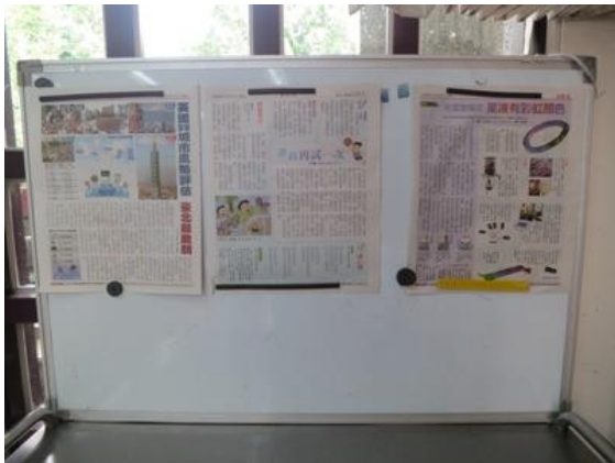
無處不書，處處閱讀-讀報