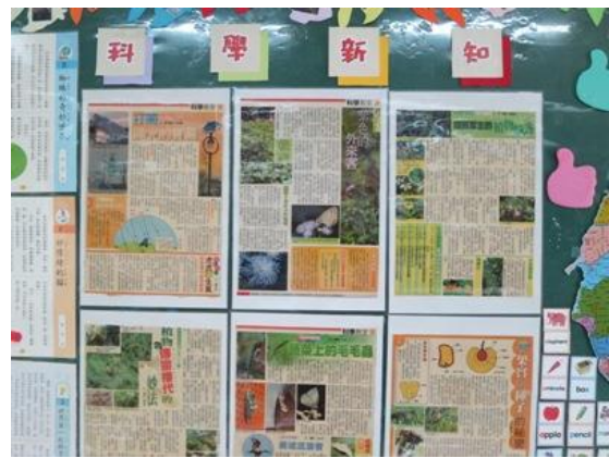
無處不書，處處閱讀-讀報