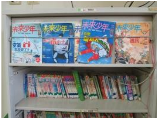
各班有專屬閱讀區域